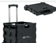
Skrzynka bagażowa Gadżety